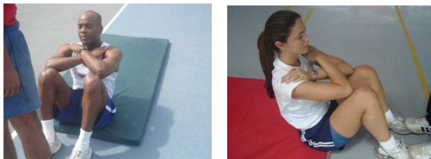
Figura 3 – Flexão de tronco sobre as coxas para os sexos masculino e feminino

Neste exercício serão exigidos os mesmos padrões de execução para ambos os sexos.